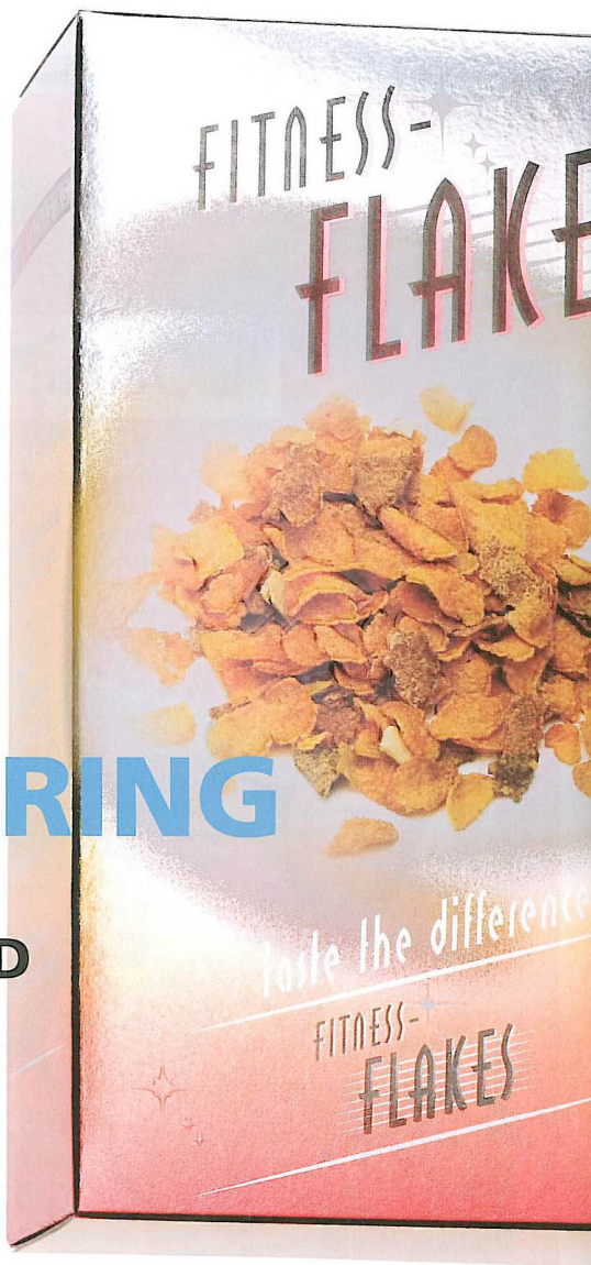
Ute i Europa har användningen av kallfoliering tagit fart och tekniken erbjuder helt nya möjligheter till dekor.

Inom varmpräglning levererar Zetatrade folier, maskiner, jigggar, klichéer till i stort sett all typ av märkning inom den grafiska industrin, men även folier och maskiner för bilindustri, ramlistindustri, läkemedelsindustri och möbelindustrin.