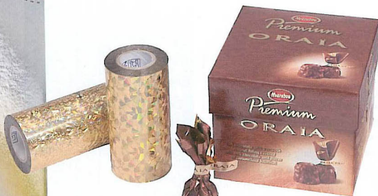
Varmprägling används flitigt på förpackningar för premiumchoklad.